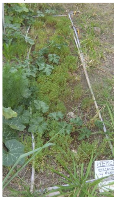
Que sont les engrais verts?