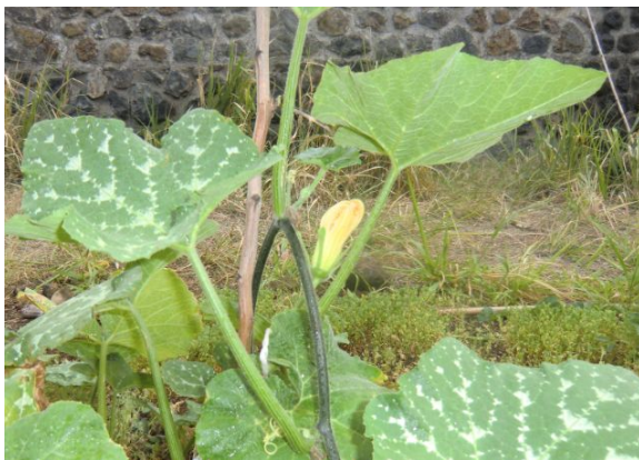
1ere fleur de nos courges