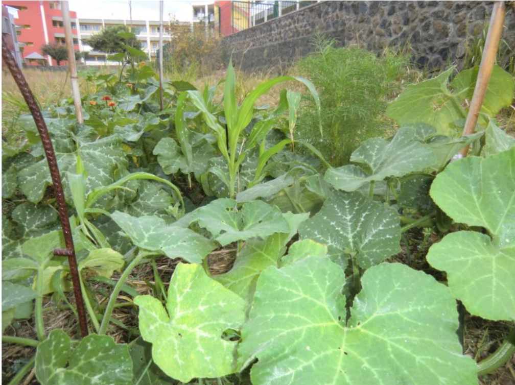
Une milpa en croissance " les 3 soeurs: courges, haricot et maïs"

Dans le cadre des MPS, en parallèle avec le cours de 2nde SVT , ces potagers sont le support concret pour illustrer et approfondir le cours de SVT (sur la photosynthèse, la gestion des sols ressource fragile, écosystème, nourrir l'humanité et l'alternative à l'agriculture intensive).